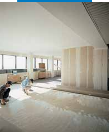
Нанесение клея Aquasol T под укладку рулонного покрытия