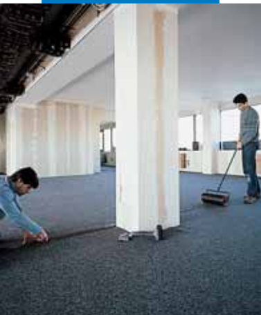
Прокатка швов коврового покрытия вальцами