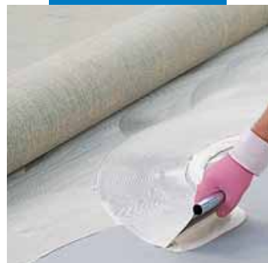
Укладка линолеума на Aquasol T