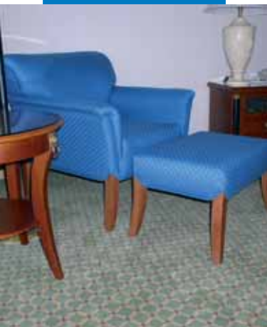
Пример укладки коврового покрытия на Aquasol T - отель "Мариотт", Австрия