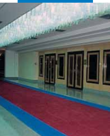
Пример укладки коврового покрытия в коридоре Государственного Церемониального Дворца в Италии