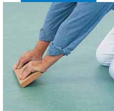
Прижатие шва линолеумного покрытия