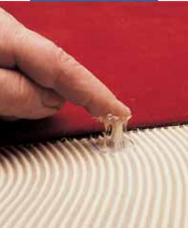
Определение контактной клееспособности Aquasol T