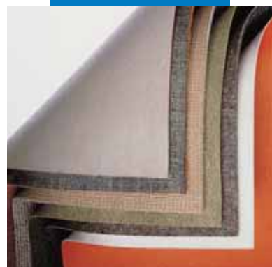
Тыльные стороны ковровых покрытий, укладку которых можно производить с помощью Aquasol T